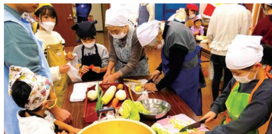
陽光自治会 焼き芋×豚汁会

助成金の財源は皆さまからご協力いただきました、社会福祉協議会会員会費・共同募金を財源としています。