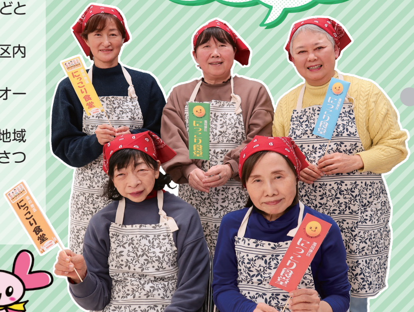
濁川地区にっこり食堂のみなさん

「濁川地区にっこり食堂」は、どなたでも気軽に立ち寄れる地域食堂です。3月29日土に濁川公民館でお待ちしています!