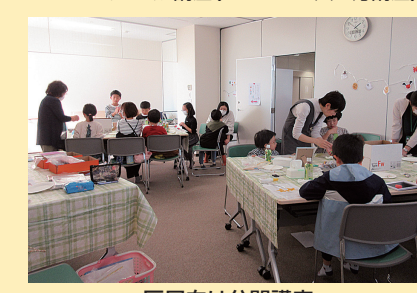
区民向け公開講座 (秋のキッズワークショップ)