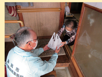
おせち料理宅配事業(12月30日)