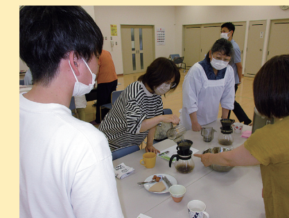
長浦・岡方地区ボランティア きっかけづくり講座(コーヒーの入れ方講座)