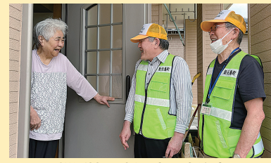
松浜地区・新元島町自治会