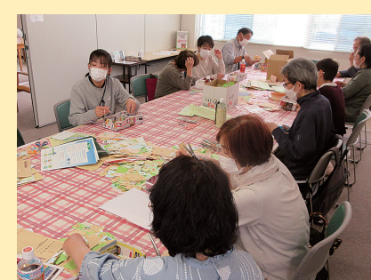
ボランティアカフェ(毎月1回開催)