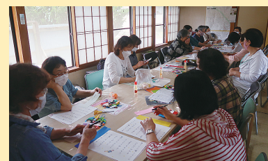
濁川地区・濁川1丁目自治会コスモスの会

地域の集会所や公民館などを利用して、子どもや高齢者、障がい者等だれもが気軽に集まり交流する活動(地域の茶の間、子育てサロン、子育てサークル、こども食堂など)