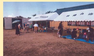
子どもたちと遊ぼう!新緑夏祭り (南浜地区・新緑自治会)