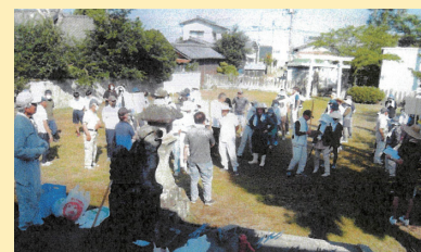
地域ふれあい一斉清掃 (葛塚地区・新鼻本村自治会)